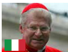
Cardenal Angelo Scola Arzobispo emérito de Milán.