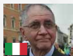
Rocco Buttiglione Ex Presidente de la Cámara de Diputados.