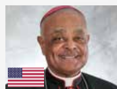
Cardenal Wilton Gregory Arzobispo de Washington.