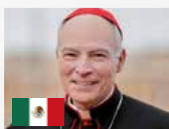
Cardenal Carlos Aguiar Retes Arzobispo Primado de México.