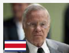
Miguel Ángel Rodríguez Ex Presidente de Costa Rica.